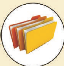
Annual Report for Parents