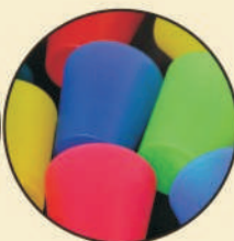
Clay & Play