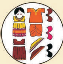
Art & Craft