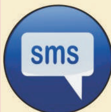
In or Out Sms Facilities