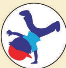
Dance & Aerobics