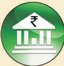
Child Saving Plan